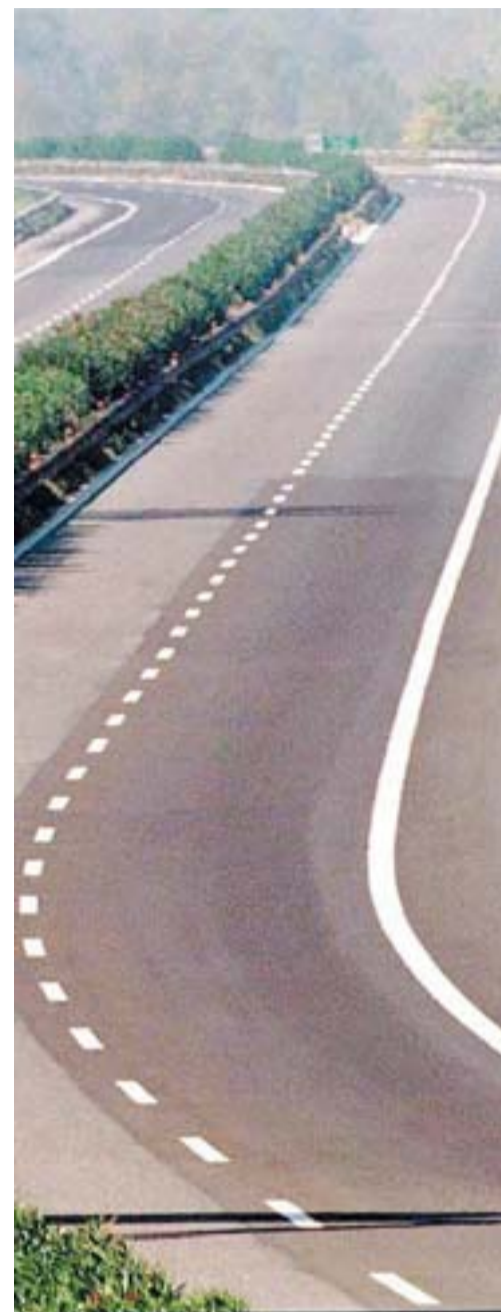
Anas Il progetto preliminare prevede 13 lotti

Consulta del Cassinate, siamo impegnati sin dal 2005 per fare in modo che venga realizzata la stazione in linea Tav collegata con la linea ferroviaria Cassino-Campobasso. Sarebbe questa un'altra importantissima opera infrastrutturale che, affiancata al costruendo tronco autostradale, darebbe ulteriore sviluppo all'economia generale di questa vasta area a cavallo delle regioni Molise, Campania e Lazio, di cui Cassino è il naturale punto gravitazionale economico e sociale». Il progetto preliminare, redatto dall'Anas, prevede 13 lotti, di cui il lotto due, lungo circa 9 km, denominato «Variante di Venafro», è già in corso di costruzione, con un investimento di 76 milioni di euro e una previsione di ultimazione dei lavori entro agosto di quest'anno. L'importo complessivo dell'investimento necessario ammonta ad oltre 3.500 milioni di euro.