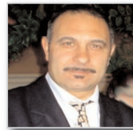
LUIGI DI MAIO

re di non cambiare nulla; in ogni caso il vostro comportamento determinerà un percorso che segnerà significativamente il prossimo quinquennio. E cinque anni non sono pochi. E allora siate protagonisti, anche con il voto, per una partecipazione attiva! Io assieme ad altri abbiamo pensato che sia giunta l'ora di dare una svolta rispetto al recente passato. Negli ultimi cinque anni la giunta comunale ha gestito Vitulazio solo nella